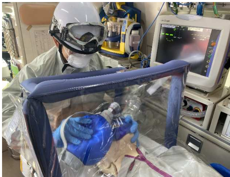
車内でのコロナ対応訓練