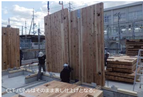
CLT パネルはそのまま仕上げとなる。