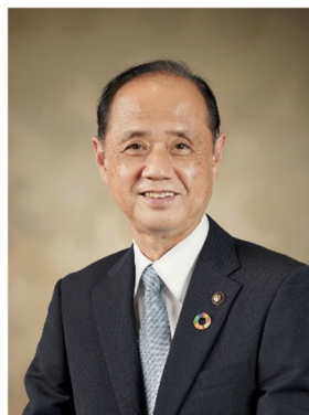
岡山市長 大森 雅夫