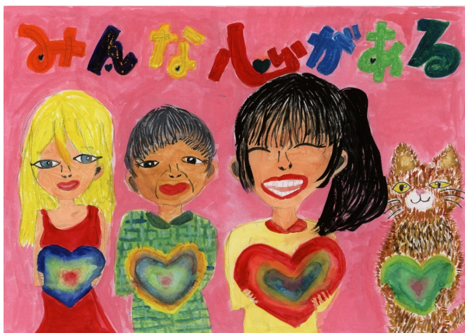
(令和6年度人権啓発ポスター優秀作品より)

市内には、人権啓発活動を行っているNPO (*12) や市民団体が多数存在します。これらの団体と積極的に連携を図り、市民参加による人権教育・啓発を推進するためのネットワークづくりを目指します。また、人権課題の解決に向けて、自主的な取組を行っている団体等に対して、人権啓発活動補助金 (*13) をとおして支援することにより、市民等との幅広い協働により、人権教育・啓発の推進を目指します。