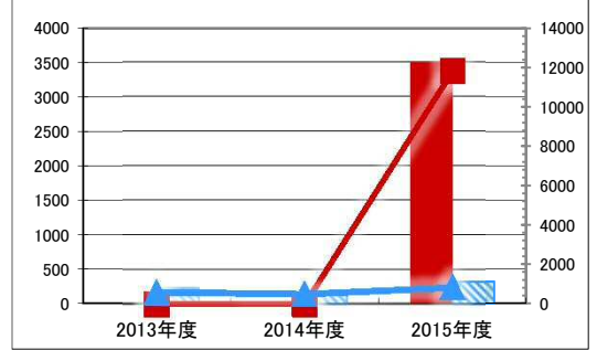
(千円) 【歳出の推移】 (円/㎡)

凡 当該施設 総額(千円) 延床面積あたり(円/㎡) 例 分類平均 総額(千円) 延床面積あたり(円/㎡)