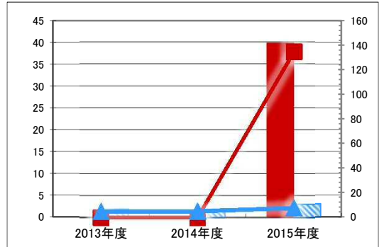
(千円) 【歳入の推移】 (円/㎡)

凡 当該施設 総額(千円) 延床面積あたり(円/㎡) 例 分類平均 総額(千円) 延床面積あたり(円/㎡)