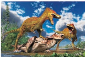
復元画：月本佳代美※画像はイメージです

期間 7月13日(土)～9月1日(日) 費 一般1,300円、小・中・高校生800円、未就学児(3歳以上)500円