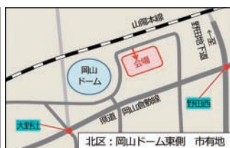
岡山ドーム東側市有地 (北区野田四丁目)