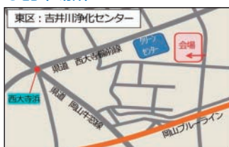
吉井川浄化センター (東区西大寺新地)