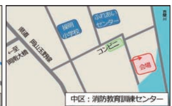
消防教育訓練センター (中区桑野)