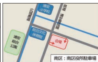
南区役所駐車場 (南区浦安南町)