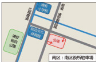
南区役所駐車場 (南区浦安南町)