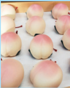
▲吉備津彦神社の桃のおみくじ

「桃太郎伝説」ゆかりのスポットが多くある「吉備路エリア」。巨大古墳をはじめ、巨石や神社、山城など謎多き遺跡が集中しています。自転車道が整備されていて、観光にも便利。ゆったりと自転車で古代の謎とロマンに浸ってみませんか?