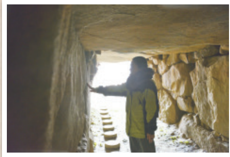
吉備の国は古代の貴重な古墳が目白押し。石室に触れて時代の息吹を感じる。