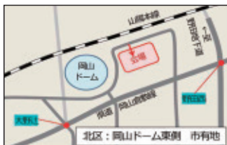
岡山ドーム東側市有地 (北区野田四丁目)