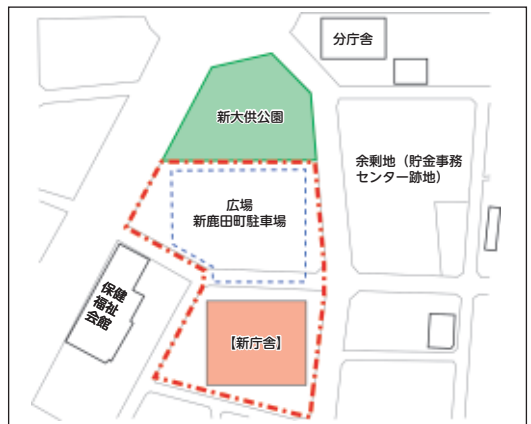
新庁舎・駐車場・公園などの配置は仮のイメージです。