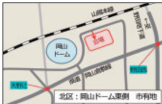
岡山ドーム東側市有地 (北区野田四丁目)