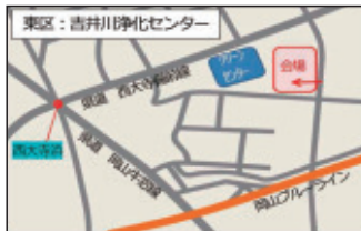
吉井川浄化センター (東区西大寺新地)