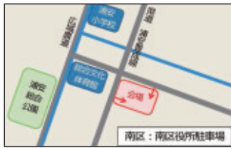
南区役所駐車場 (南区浦安南町)