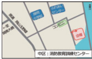
消防教育訓練センター (中区桑野)