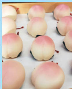
▲吉備津彦神社の桃のおみくじ

「桃太郎伝説」ゆかりのスポットが多くある「吉備路エリア」。巨大古墳をはじめ、巨石や神社、山城など謎多き遺跡が集中しています。自転車道が整備されていて、観光にも便利。ゆったりと自転車で古代の謎とロマンに浸ってみませんか？