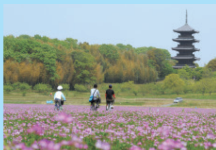
▼吉備路サイクリング