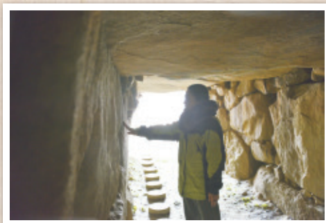
吉備の国は古代の貴重な古墳が目白押し。石室に触れて時代の息吹を感じる。