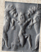
ライオンと闘う英雄 イラク、前2200年頃 平山郁夫シルクロード美術館

紀元前2千年紀前半に記された『ギルガメシュ叙事詩』は、ギルガメシュとエンキドゥとの友情を印象深く語っています。後の旧約聖書やホメーロスの叙事詩にも、悲しくも美しい友情が描かれてゆきます。それらは友の死という共通テーマに、それぞれの文化的特色が加えられています。こうした友情物語を、個が自覚され始める人類精神史の一段階として考えてみましょう。