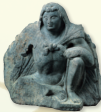
ヘラクレス パキスタン、100-300年頃 平山郁夫シルクロード美術館