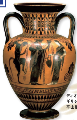
ディオニソス ギリシア、前520-500年頃 平山郁夫シルクロード美術館