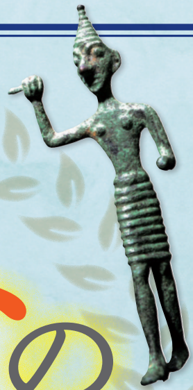
パール シリア、前1500年頃 岡山市立オリエント美術館