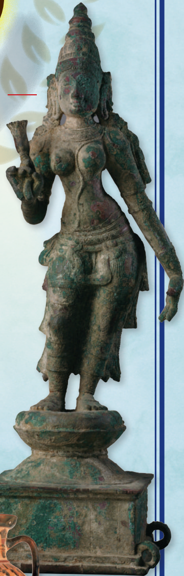
パールヴァティー インド、1100-1200年頃 石洞美術館