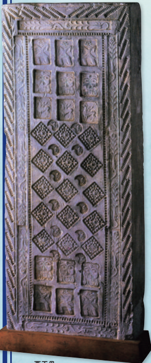
西王母 中国、前200-後220年頃 天理大学附属天理参考館