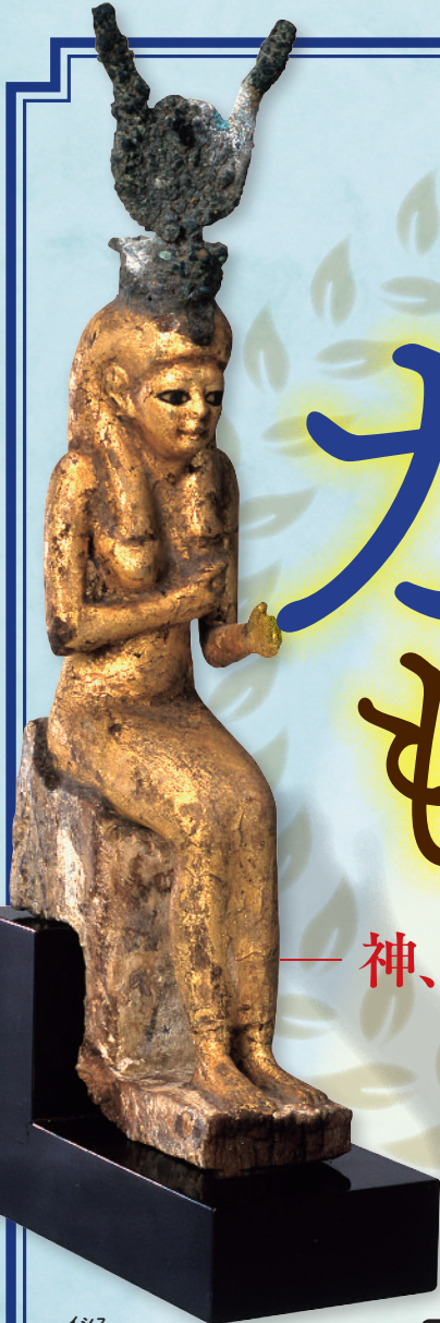
イシス エジプト、前332-30年頃 天理大学附属天理参考館