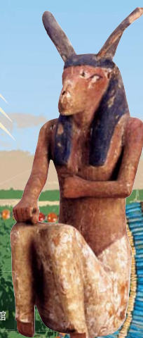
精霊像 前1550-1069年頃 天理大学附属天理参考館