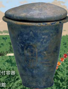
アメンヘテプ3世銘入蓋付容器 前1550-1295年頃 岡山市立オリエント美術館