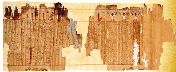
タネフェルトの『死者の書』 前332-30年頃 平山郁夫シルクロード美術館