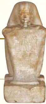
メンチュエムハトの方形彫像 前650-332年頃 岡山市立オリент美術館

13:30-16:00 ※終了時間は前後する場合がございます。 オリент美術館地下講堂 聴講料500円(友の会会員は300円) 要申込み(定員80名)