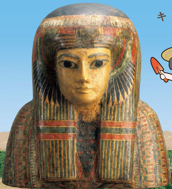
彩色人型木棺頭部 前747-332年頃 松岡美術館