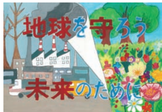
岡山県 環境保全事業団 理事長賞