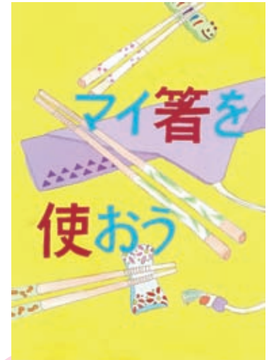
岡山ESD 推進協議 会長賞