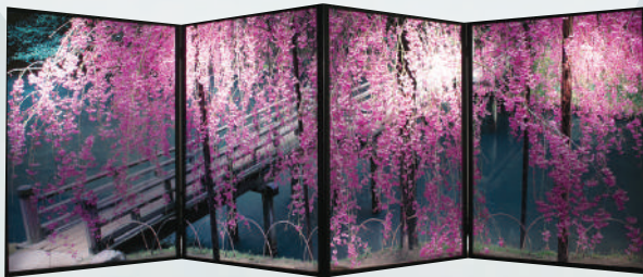
「しだれ桜と茶唱橋」 難波由城雄

当館では、歴史資料や美術・工芸品など、岡山にゆかりのある様々な文化財を収蔵しています。令和6年度に当館へ新たに仲間入りした文化財から、数点をピックアップしてご紹介します。