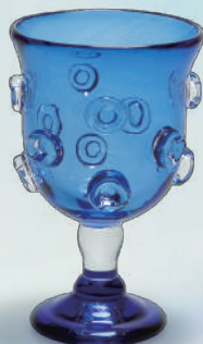
「紺色脚付杯」新谷良造