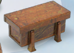
「神代櫻沈金香合」 小川一洋