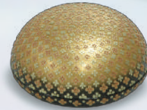
「油漆堆錦彩華文合子」 山口松太