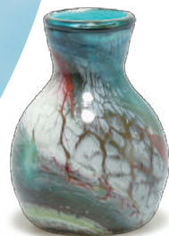
「花器 マーブル」新谷良造