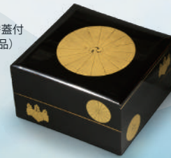
定紋入五段重箱 替蓋付 (個人蔵、当館寄託品)

2026年NHK大河ドラマ「豊臣兄弟!」でも大注目の豊臣家。岡山も豊臣家にゆかりがあることをご存知ですか? 現在の岡山市北区足守地域は、江戸時代に足守藩木下家が治めていました。初代藩主の木下家定は、豊臣秀吉の正室・北政所ねねの実兄にあたります。今回は、備中足守藩木下家資料より、豊臣家に関わる資料を展示します。