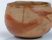
火櫛茶碗 (古備前木村コレクション)