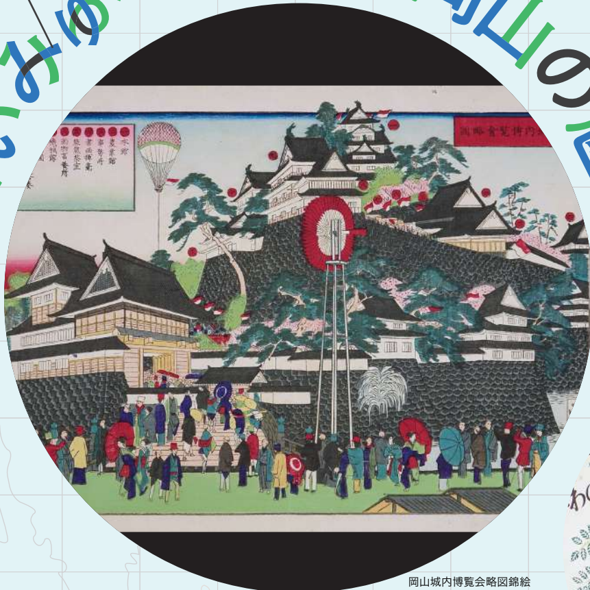
岡山城内博覧会略図錦絵