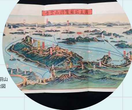
国立公園岡山 遊覧案内絵図