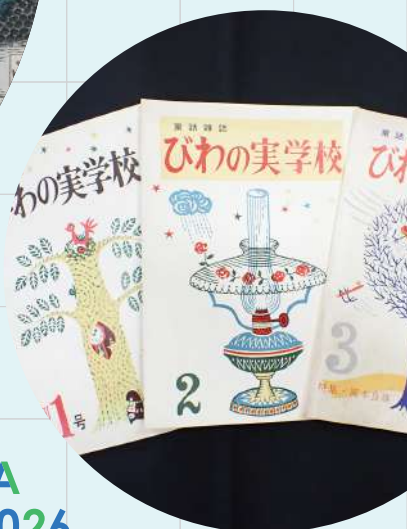
坪田譲治のびわの実学校