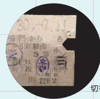
切符(鳴門駅〜迫川駅)

◎65歳以上の方(シルバーカードなど年齢を確認できるものを提示いただきます) ◎身体障害者手帳、療育手帳、精神障害者保健福祉手帳、自立支援医療受給者証、心身障害者医療費受給資格者証、特定疾患医療受給者証、特定医療費(指定難病)受給者証、小児慢性特定疾病医療受給者証または介護保険被保険者証をご持参の方と付添人1名(いずれも各々の手帳等または障害者手帳アプリ「ミライロID」の提示が必要です) ◎保育園児、幼稚園児、小学生、中学生を学習活動のために引率して入館する場合の引率(入館料減免申請書の事前提出が必要です)