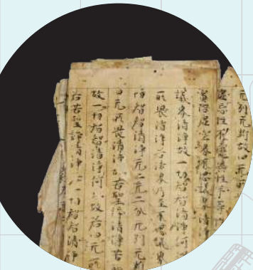
岡山市重文・大般若波羅密多經