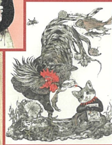
《ギョスターヴ若冲雄鶏園》2016年