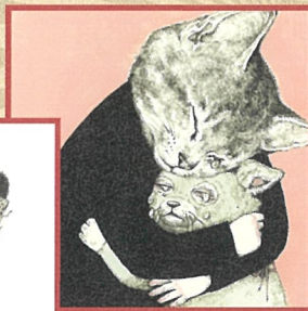
『ふたりのねこ』原画 2014年