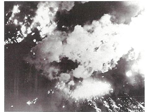
空襲される岡山市街地 1945年6月29日