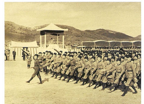
警防団防空隊の分列式 1942年11月29日