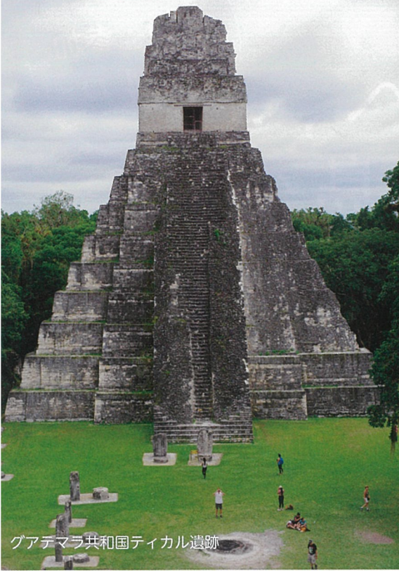
グアテマラ共和国ティカル遺跡