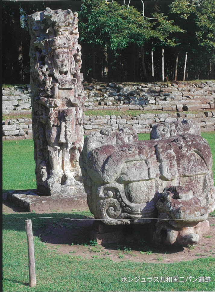
ホンジュラス共和国コパン遺跡