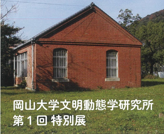
旧陸軍赤レンガ建物（津島キャンパス）