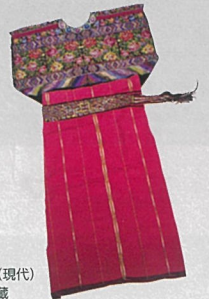
マヤ系先住民民族衣装 (現代) BIZEN 中南米美術館蔵

世界史上でも有数の凄惨な侵略戦争であったスペインによる古代マヤの征服。その戦争を経てもマヤ文化は絶えることなく現代も息づいています。BIZEN中南米美術館などの協力による美しい展示品とともに、その始まりから隆盛の歴史の概略を紹介します。