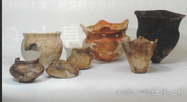
津島岡大遺跡出土縄文土器

岡山大学文明動態学研究所 文化遺産マネジメント部門 Tel：086-251-7290 E-mail：arc@cc.okayama-u.ac.jp