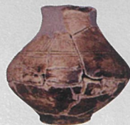
津島岡大遺跡出土 文明動態学研究所蔵

縄文時代から近代にかけての津島の歴史を、40年間蓄積された発掘調査成果をもとに復元します。津島一帯の遺跡から出土した資料も盛りだくさんです。