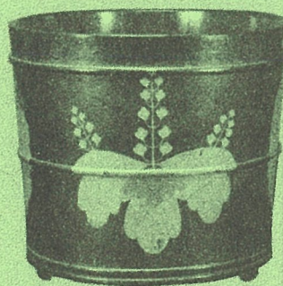
風呂桶（備中足守藩 木下家資料）