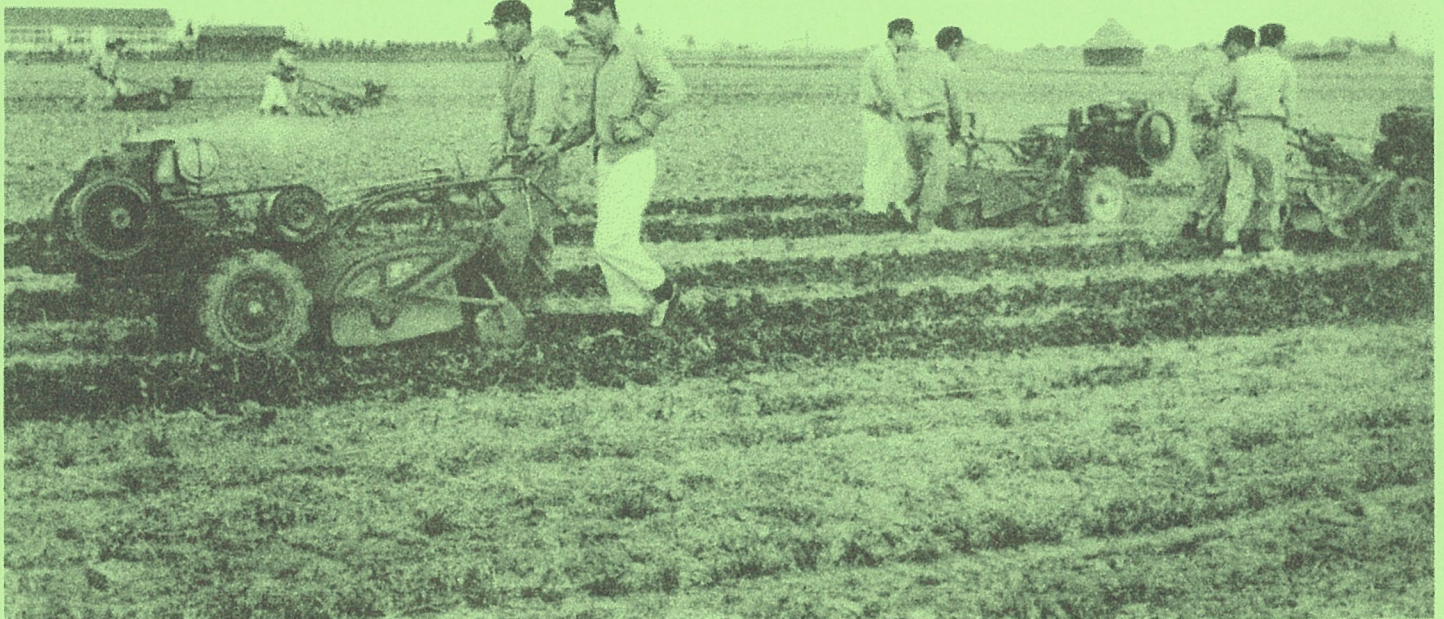
耕耘実習 岡山県立興陽高等学校所蔵