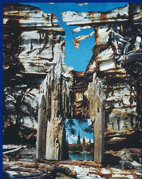
過ぎゆくものから 青空 1991