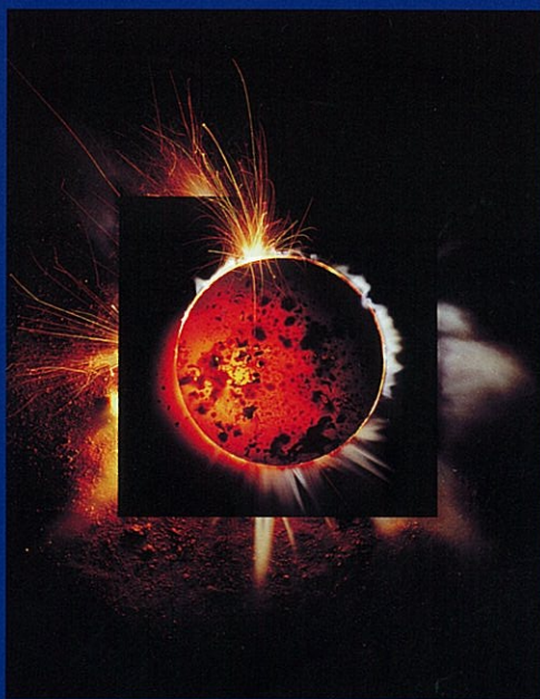
Prometheus on the Rock of Marnai VI・A 2000