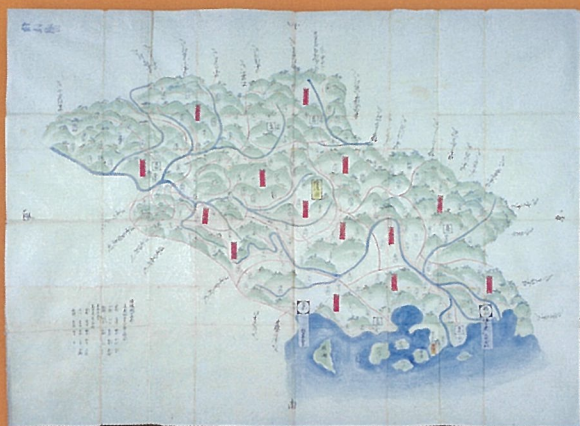
備後国絵図 (制作年未詳 T1-96 118.4cm×164.8cm)