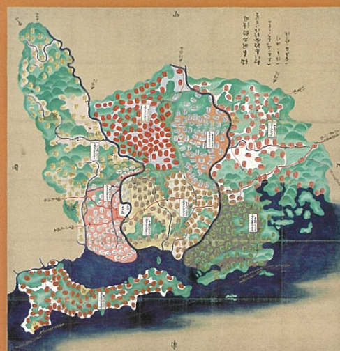
備前国九郡絵図 (寛永年間 1624年-1644年 T1-14 193.4cm×188.5cm)