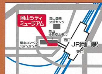
JR岡山駅より東西連絡通路直結 徒歩2分