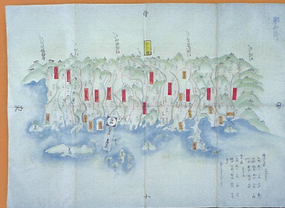
讃岐国絵図 (制作年未詳 T1-88 77.6cm×106.4cm)

寛永9年(1632)大御所 徳川秀忠が亡くなり、三代将軍徳川家光の「御代始め」となりました。手始めに熊本藩の加藤忠広が改易され、この年、池田光政も鳥取から岡山に転封されています。翌寛永10年(1633)、徳川家光は諸国の政治を監察するため巡見使を派遣しました。巡見使は各地で国絵図を徴収しています。この国絵図が幕府で集成され、それを寛文年間(1661~73)に模写したものが「日本六十余州図」です。この図はいくつかの大名家に残されていますが、池田家文庫のものは諸本のうちで最も描写や彩色が丁寧で、原本に近いものです。幕府はこの図に基づいて日本図も作成しています。「六十余州図」とともに、江戸時代前期の国絵図とその作成に関わる史料を通して、当時の人びとに映った「日本」の姿を見たいと思います。