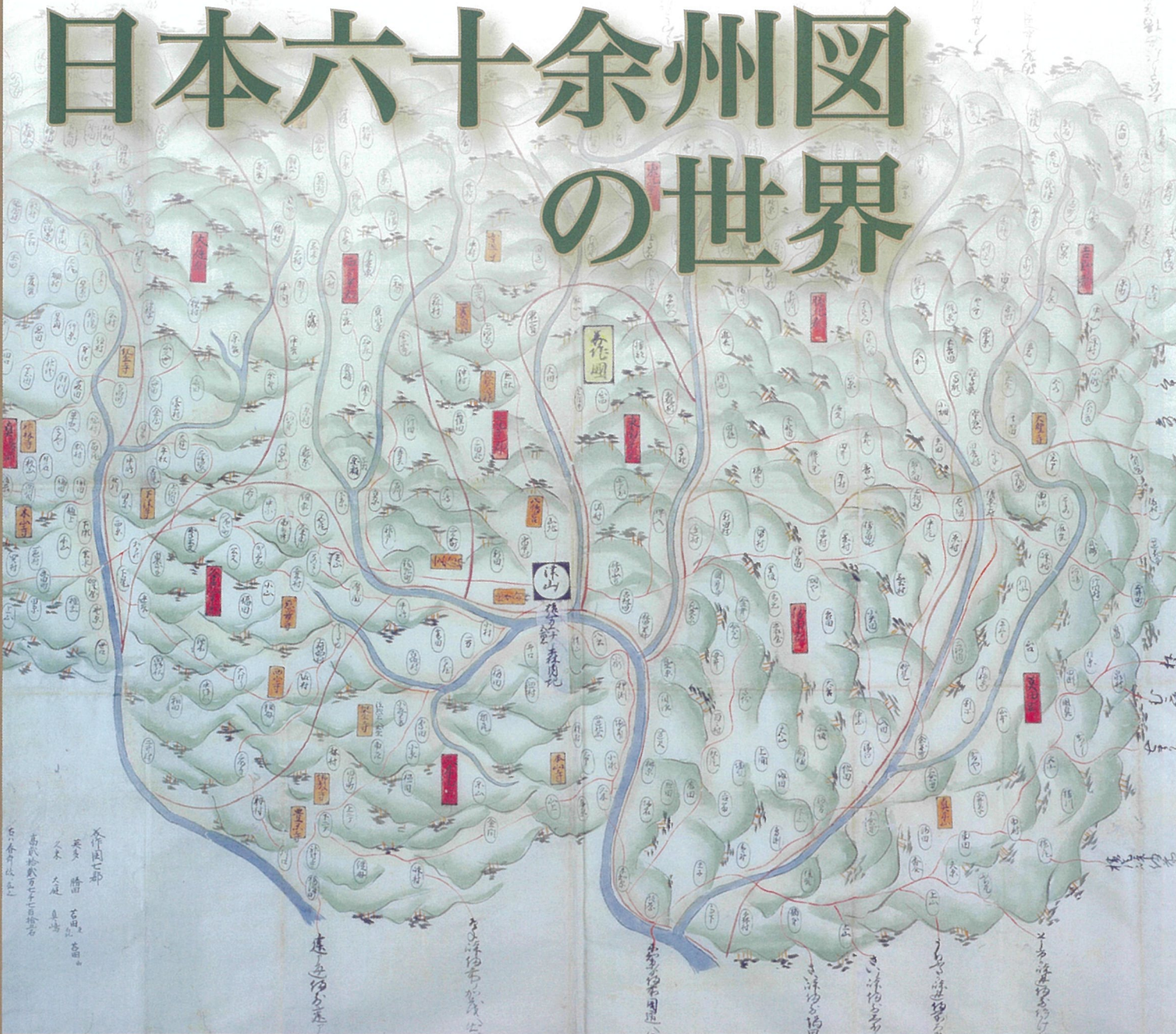
美作国絵図 (制作年未詳 T1-94 116.7cm×164.1cm 部分)