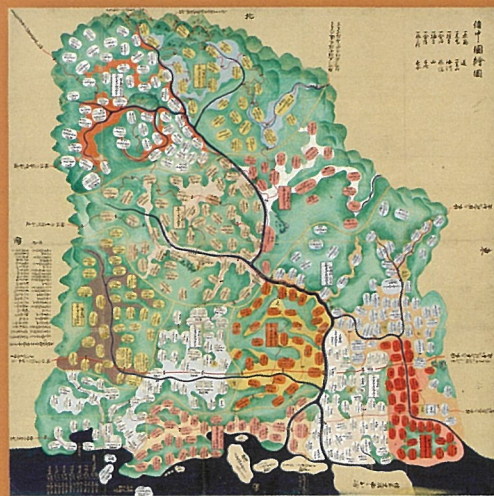
備中国絵図 (寛永年間 1624年-1644年 T1-30 190cm×189.2cm)