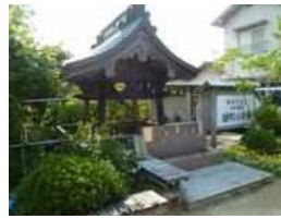
④雄町の冷泉 岡山市で唯一の全国名水百選