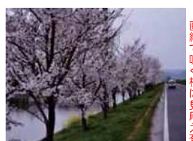
⑪ 百間川堤防の桜並木