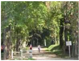
①龍ノロ山ハイキング 標高257m ハイキングに最適