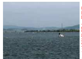
⑩ 百間川ボートコース