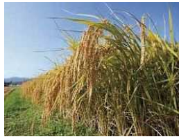
③雄町米 高級清酒の酒米で全国的に有名