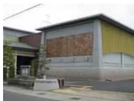
①6 埋蔵文化財センター