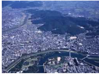
空からの操山通景