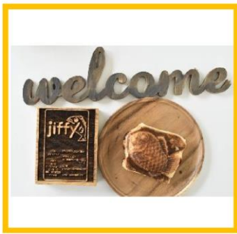
⑧デニッシュたい焼き jiffy