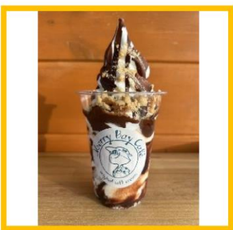
⑰メリーベイカフェ