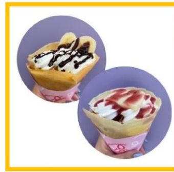
⑱T's Kitchen YOTTE