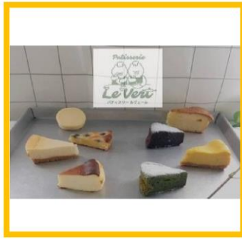
⑨パティスリールヴェール