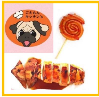
⑯ごえもんキッチン's