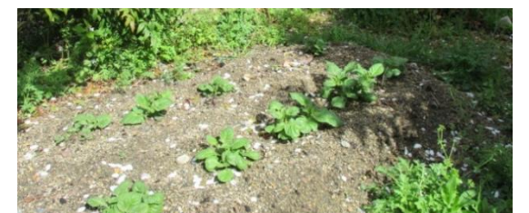
↑4月17日(金)ジャガイモの様子です。

一緒にお花のお世話をしてくださる方も募集中です。 できる人ができるときに、できることをお願いします。