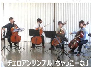
チェロアンサンブル「ちゃっこーな」

11月22日(土)23日(日)、第26回文化祭を開催しました。展示、実技発表以外に喫茶やうどんコーナー、野菜やおにぎりの販売、また高校生ボランティアグループ「ハイス쿨ー」のイベントコーナーなど盛りだくさんの内容で、たくさんの方々に楽しんでいただきました。ご参加、ご協力くださったクラブ講座の皆様をはじめ、ご支援いただいた団体の皆様、ありがとうございました!