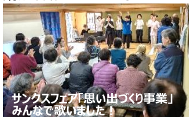
サクソフェア「思い出づくり事業」みんなで歌いました!