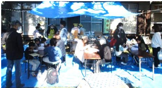
庭を使って、弘西地区交通安全母の会のうどんコーナー