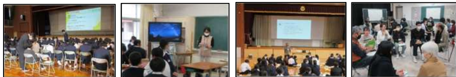
6年生全員を対象にした「防災教室」の様子 (左:中山小学校、右:平津小学校)