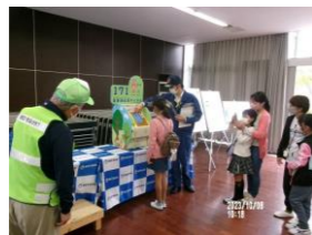
災害伝言ダイヤル体験

【休館日】11月1日(水)、3日(金祝)、8日(水)、15日(水)、22日(水)、23日(木祝)、29日(水) 12月6日(水)、13日(水)、20日(水)、27日(水)～31日(日)