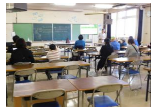
アマチュア無線講習

この防災キャンプでは、御南中学校の生徒が地域のミドルリーダーとして活躍しています。今回は中学生が考えた防災クイズや紙食器作りなどを行い、小学生親子に防災の大切さを伝えました。また、市民病院の災害医療講習や災害伝言ダイヤルの体験、無線講習など新たな内容も多く取り入れ、参加者が順番に見て・聞いて・体験することで防災意識を高める機会となりました。