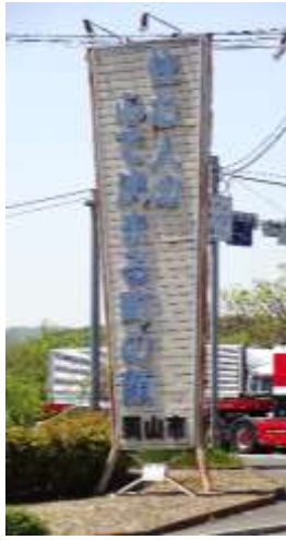
【三面に書かれているPR文字】