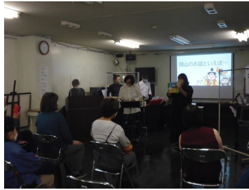
地域ふれあい事業 (11/12) 「オータムコンサート」