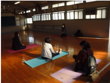
ちびっこわいわい(11月21日) 「ママのための骨盤ヨガ」