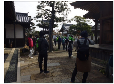
上南今昔絵図巡り ウォーキング(11/19)