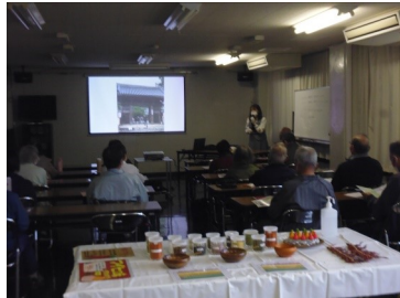
上南高齢者大学(11/29) 「鏡野の自然」