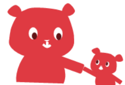
岡山市地域包括支援センター 認知症普及啓発キャラクター

もの忘れが気になっている方やご家族がおられましたら、東区地域包括支援センターへご相談ください。