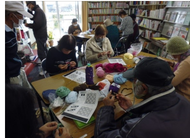
公民館カフェ (12月2日) 「編物～鍋敷づくり」