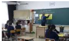
6年生は災害への備え