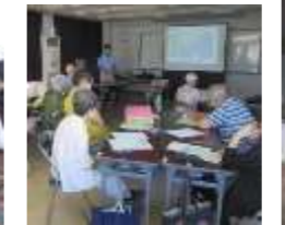
ゴミ問題を考える