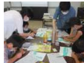
古代のころころハンコを作ろう