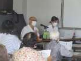
介護保険の基礎知識