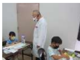
子どもあんどん作り