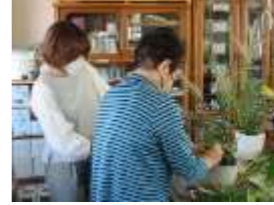
秋のフラワーアレンジ教室