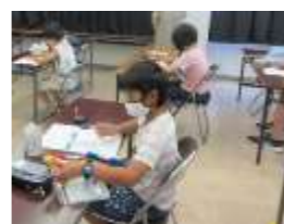
夢のレインボーハウス作り