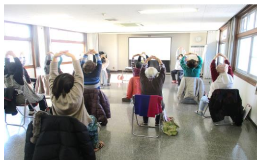
こまくさの皆さん（令和3年度受講）