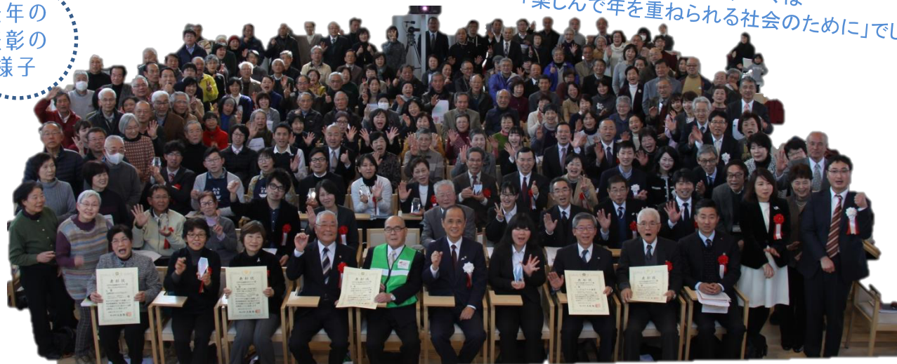
第2回表彰式(平成30年2月18日)