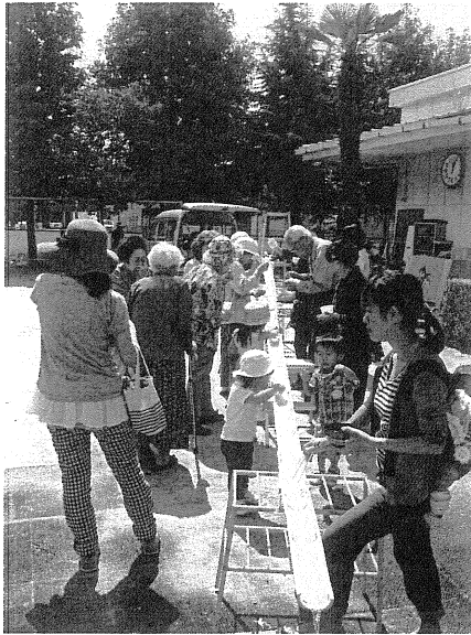
9月15日 そうめん流し サロン10人 地域の方14人参加