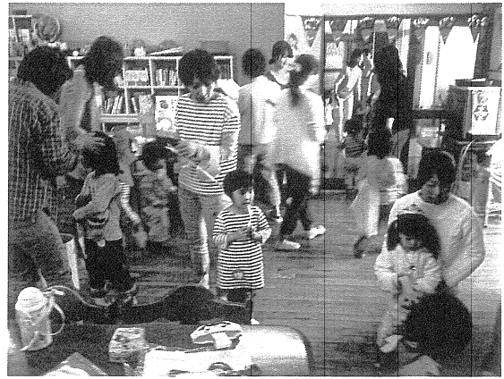
10月28日 ちょっと早いけどハロウィンパーティ 23世帯54人