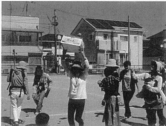
10月7日 ミニ運動会 サロン14世帯35人 地域の方2人参加