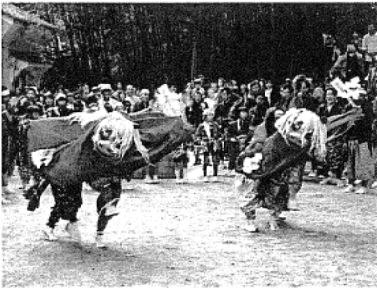
中田上之町魁組神楽保存会