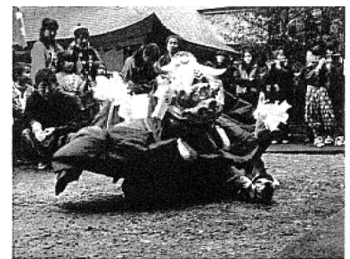
下神目神楽・棒遣い保存会