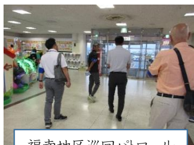
福南地区巡回パトロール