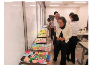
《 最終審査会の様子 》