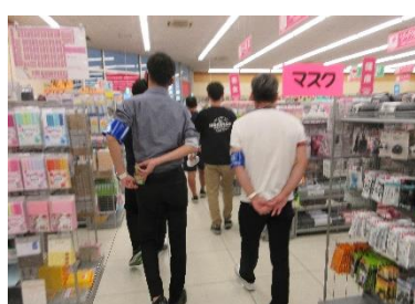
灘崎・興除・藤田地区合同補導

※その他にも、各地区内の祭りやイベント等においても、補導・声かけ活動をしていただいています。