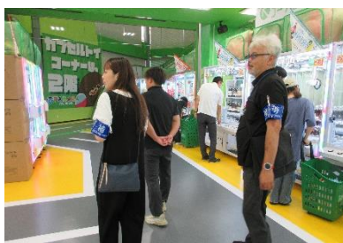
妹尾・福田地区合同補導

隣接する地区と合同で、岡山市育成委員と地域子育て支援課青少年育成係職員で各地区内の店舗や公園などを巡回し、補導・声かけ活動をしています。