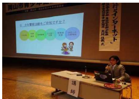
青少年健全育成大会研修会