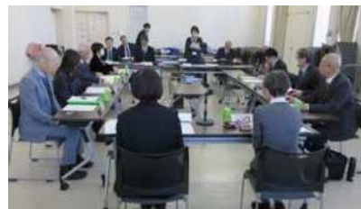
岡山市青少年問題協議会