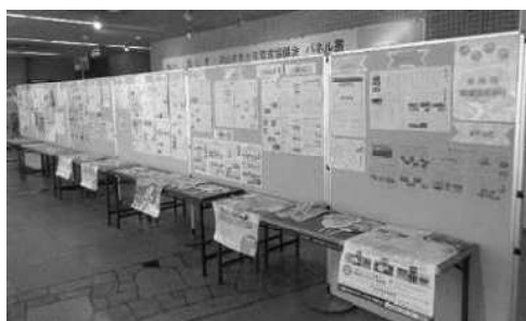
各地区育成協議会作成の広報紙展示(パネル展)