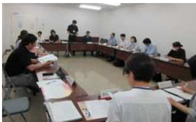
備前県民局管内青少年対策マトリックス会議