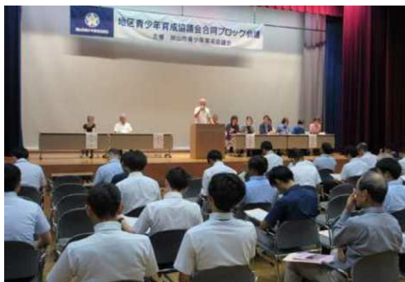
地区青少年育成協議会合同ブロック会議