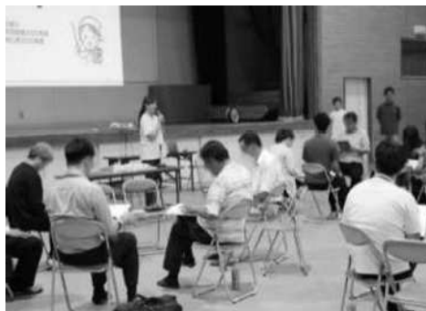
上南地区育成協議会取組(地区懇談会)