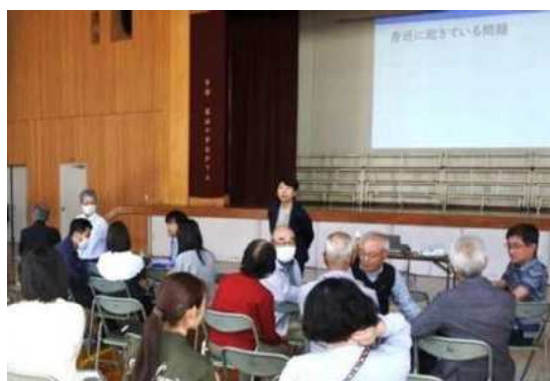
富山地区育成協議会取組 (地区懇談会)