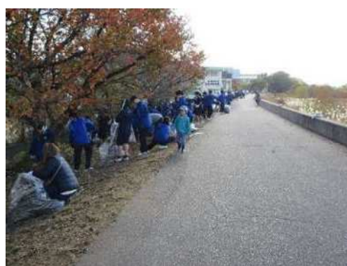
御南地区育成協議会取組 (環境浄化活動)