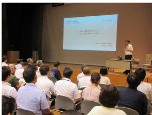
地区青少年育成協議会研修会