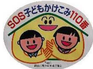
SOS子どもかけこみ110番ステッカー