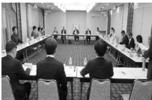
岡山市青少年育成協議会常任理事会(第1回)