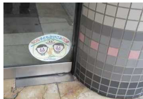
各地区でご協力をいただいている店舗等