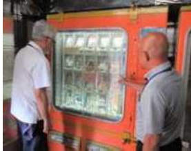
有害図書自販機調査