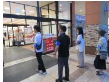
巡回パトロールの様子