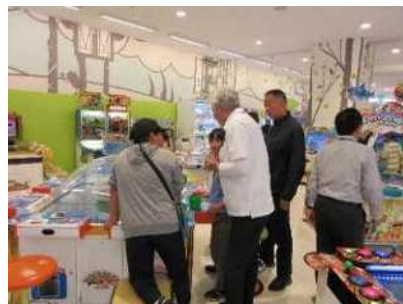
職員による日常の巡回補導