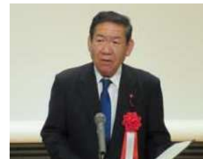
市議会副議長あいさつ