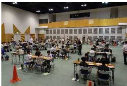
小・中学生将棋大会