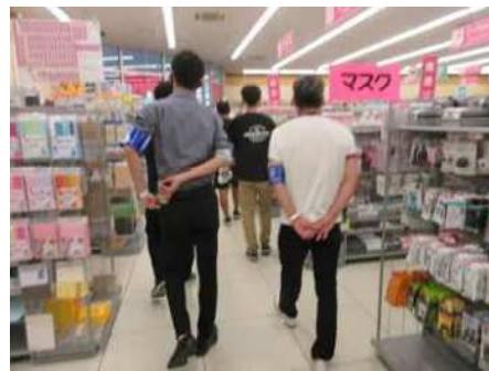
地域における育成委員との合同補導の様子