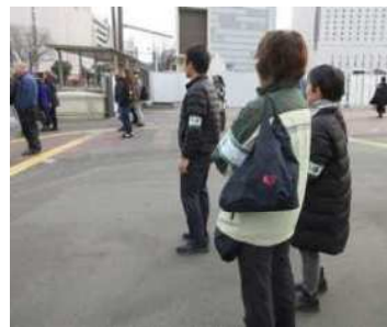
高等学校PTA連合会保導部との合同補導の様子