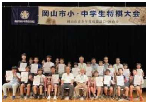
岡山市小・中学生将棋大会受賞者