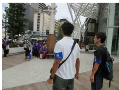
特別街頭補導（うらじゃ）