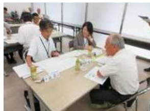
最終審査会 R7. 10. 2(金) (左:作文 下:ポスター・絵)