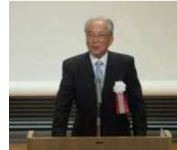
市育成協会長あいさつ