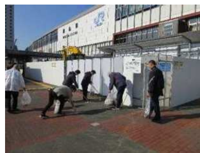
職員による環境美化活動