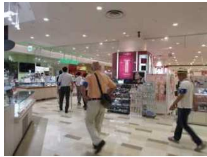
青少年育成委員と職員による巡回パトロール活動