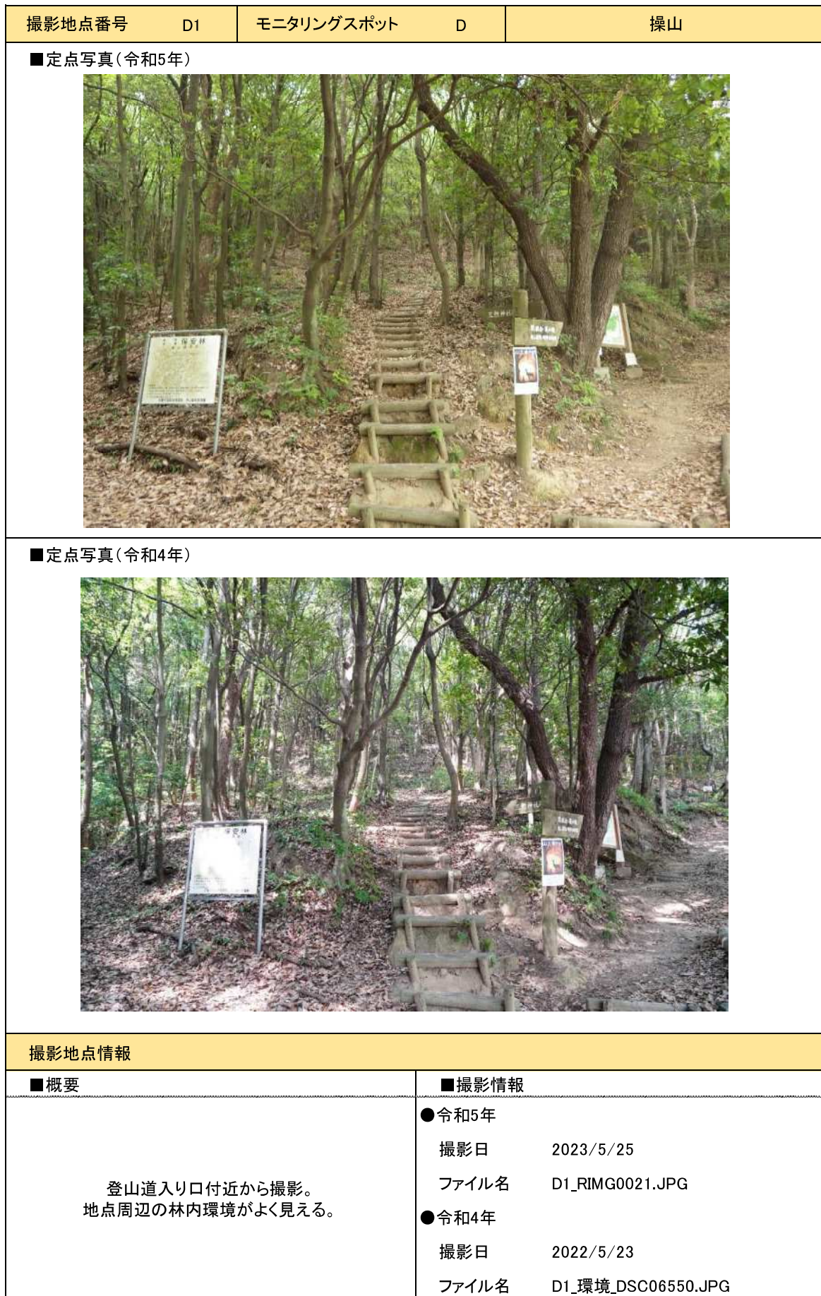
表 3-13 定点撮影地点 1/5