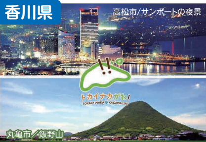
高松市 / サンポートの夜景