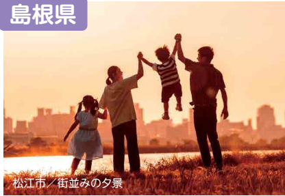
松江市 / 街並みの夕景

人とのつながり、穏やかな時間が“自分らしい明日”を後押ししてくれます。働きやすく、暮らしやすい「島根」を選んでみませんか。