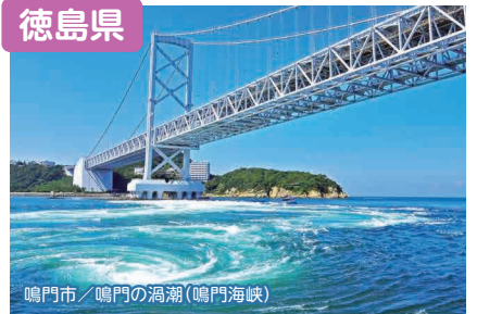
鳴門市 / 鳴門の渦潮（鳴門海峡）

豊かな自然を満喫しながら、良好なテレワーク環境が整っているとくしまで、自分らしいライフスタイルを見つけてみませんか？