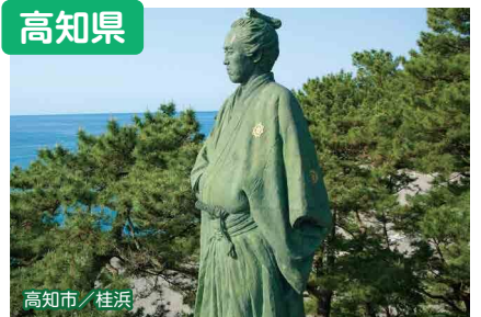
高知市 / 桂浜

高知の魅力は、新鮮で美味しい食べもの、ダイナミックな自然！そして何より、あつたかい人！「みんなあも、高知家の家族にならん？」