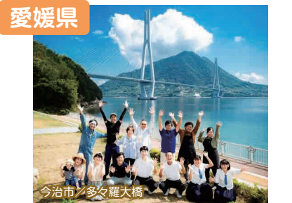
今治市 / 多々羅大橋

せとうちの温暖な気候、自然豊かな島々、ちょうどいい街。人も風土もあつたかい愛媛であなたらしいえひめ暮らしを見つけてみませんか。待ってるけん。