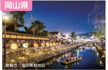
倉敷市 / 夜の美観地区

海や里山、城下町ぐらしなど様々な暮らしが選べる岡山県。地震等の自然災害が少なく、交通網も充実した「晴れの国」であなたにぴったりの暮らしを見つけてみませんか。