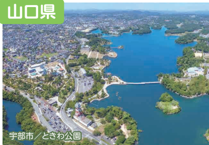
宇都市 / とさむ公園

日本海、瀬戸内海に面し、豊かな自然に恵まれ、都市部にもアクセスしやすい山口県。「意外にいいかも」と思える魅力が詰まっています！