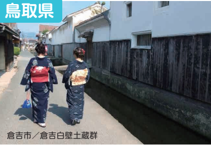
倉吉市 / 倉吉白壁土蔵群

ゆったり、うっとり、ほっこり、鳥取。暮らしの楽しみ方は十人十色。あなただけの移住物語、一緒に作ってみませんか？