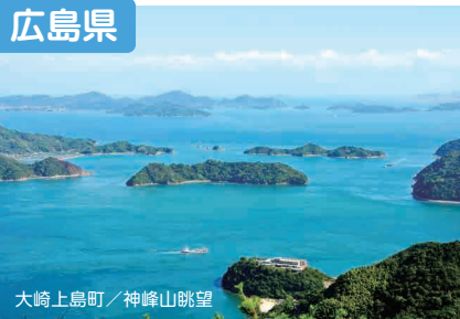
大崎上島町 / 神峰山眺望

広島県には、海・山・川の豊かな自然やそれに隣接する高い都市機能があります。広島県は、チャレンジする人や、夢を見る人を全力で応援します!!