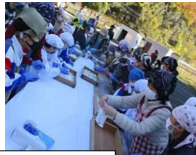
11/29 もちつき・竹小フェスティバル