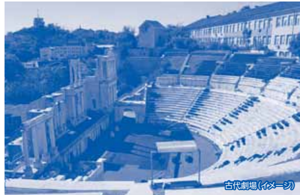
古代劇場(イメージ)