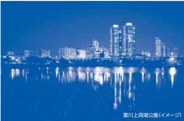
富川上洞湖公園(イメージ)