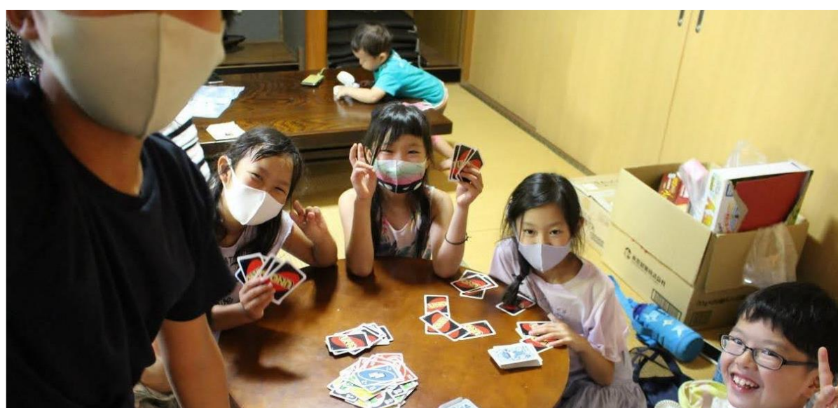
事例発表者「くらしのたね」の活動の様子