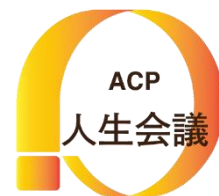
人生会議ロゴマーク

その時になって慌てないように、今から在宅医療や介護保険サービス、人生会議(※)について一緒に学んでみましょう。