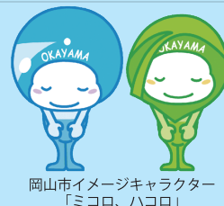
岡山市イメージキャラクター 「ミココ、ハコロ」