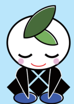
くらしき環境キャラクター 「くらしふ」