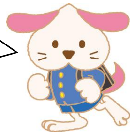
岡山市教育委員会広報専門官 こらぼん♪