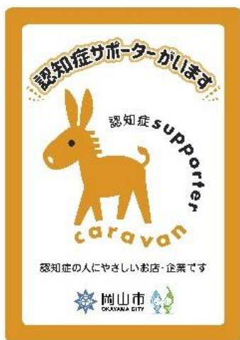
認知症サポーターステッカー