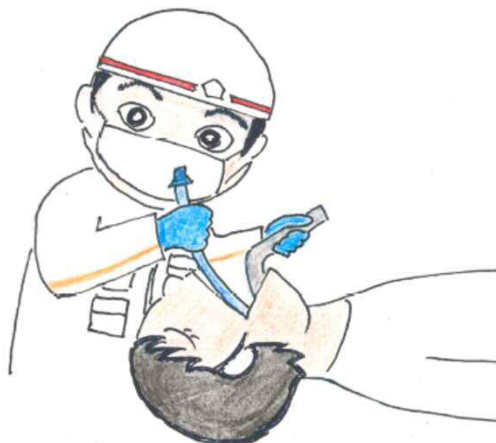
【気管内挿管などで空気の通り道をつくる】

資格ができてもうすぐ30年。救急救命士ができる処置も拡大し、救急現場での我々への期待も拡大しているんだ！