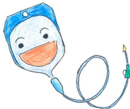
【点滴からの アドレナリン（強心剤）やブドウ糖投与】

岡山市の救急車では、3人の救急隊員の内、1人は救急救命士がのって高度な救命処置がおこなえるようにしているんだ。