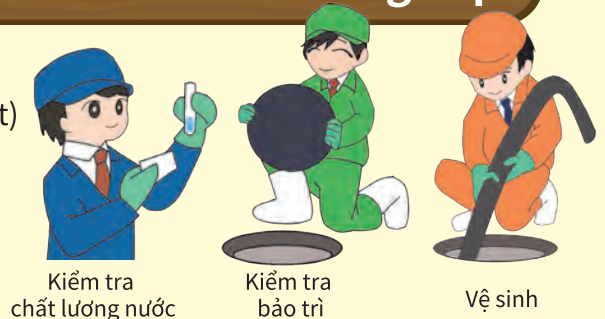
Kiểm tra chất lượng nước

(như dọn bùn bẩn, ít nhất mỗi năm 1 lần)