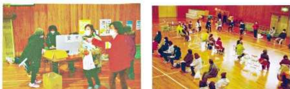
〈災害訓練 令和 3 年 1 月 24 日〉

令和 2 年度は倉敷川氾濫から身を守る避難訓練、「新型コロナウイルス」等の感染症を考慮した避難所受付訓練と、感染症が懸念される避難者の隔離・誘導の訓練にも取り組みました。